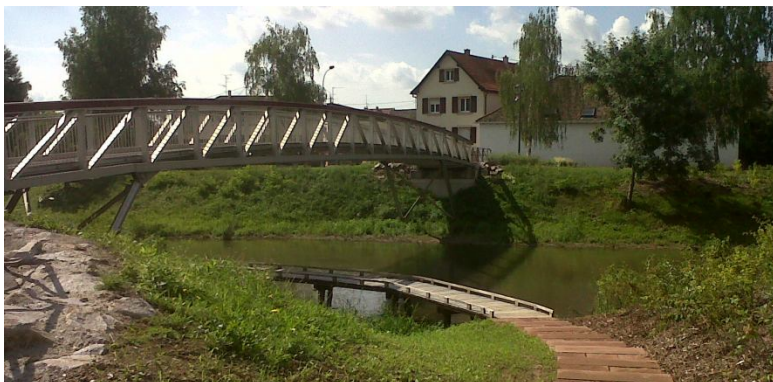
Vue de la passerelle intégrée au site