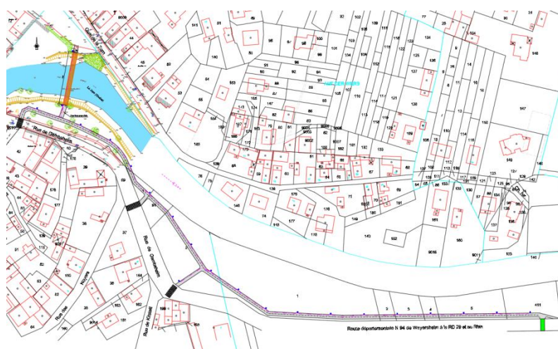
Vue en Plan de la piste reliant le quai de la Zorn à la ZA de Bantzenheim